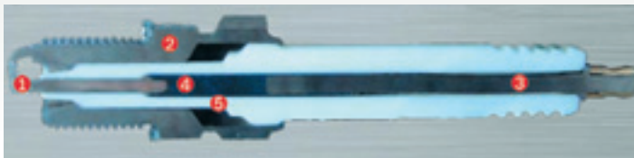
Схема свечи зажигания Bosch в разрезе

1. Платиноиридиевый сплав на центральном и боковом электродах: - специальный процесс сварки для повышения прочности и отсутствия пор в сварном шве.