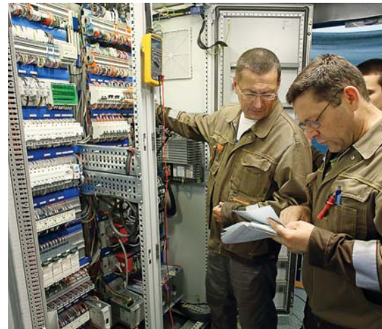
Пусконаладочные работы на ГПЭС