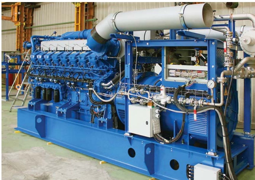
Газопоршневой энергоблок на базе двигателя GS16R2 PTK

головки блока цилиндров обеспечивают простоту обслуживания и снижение стоимости при ремонте. Благодаря конструкции двигателя имеется удобный доступ ко всем ключевым обслуживаемым элементам.