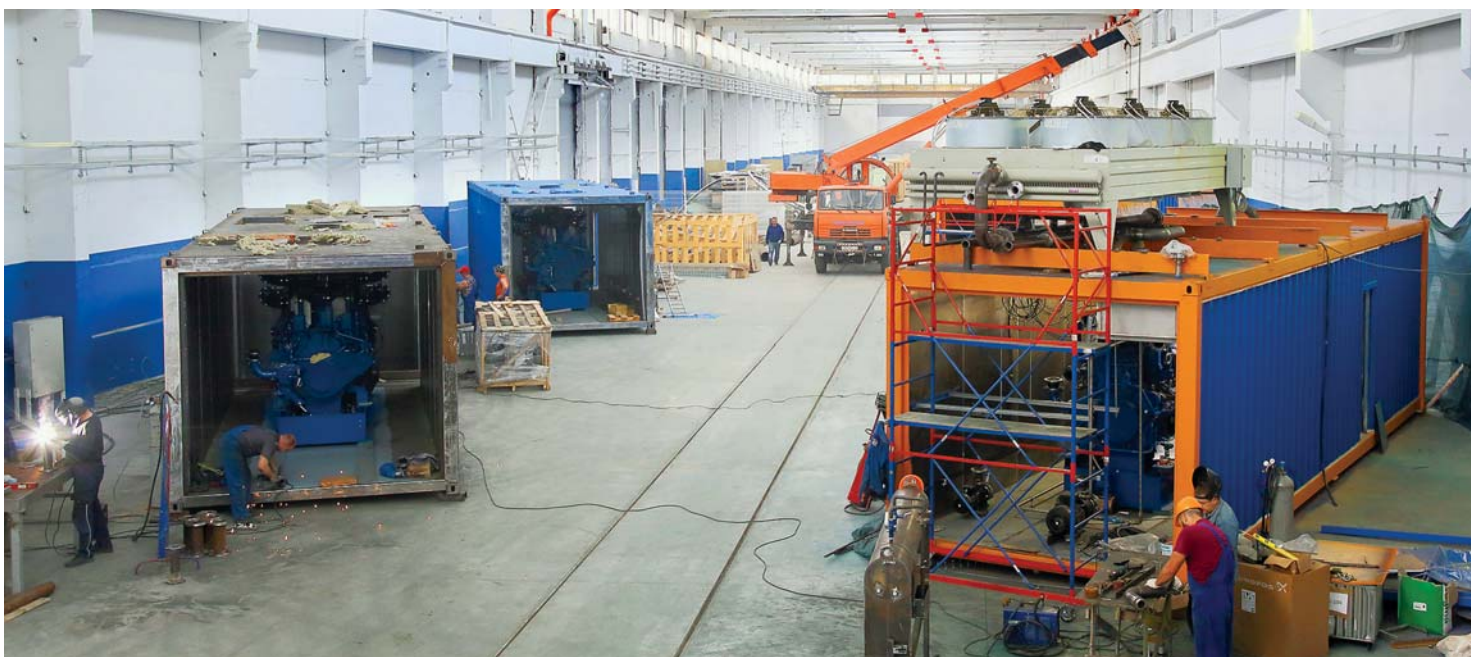
Сборочный цех ООО «КЗКТ»