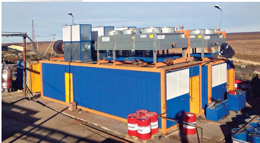
Газопоршневая электростанция контейнерного исполнения