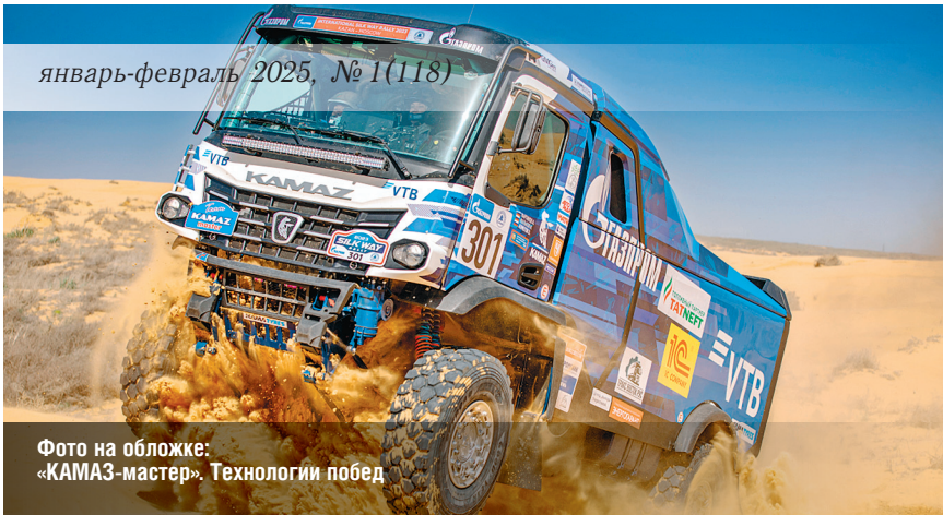
Фото на обложке: «КАМАЗ-мастер». Технологии побед