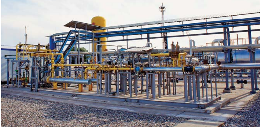
Фото 7. Система подготовки топливного и пускового газа для газоперекачивающих агрегатов ДКС «Алан»

ния. Она включает локальные САУ агрегатов, шкаф общего управления, АРМ оператора, пульт аварийного останова.