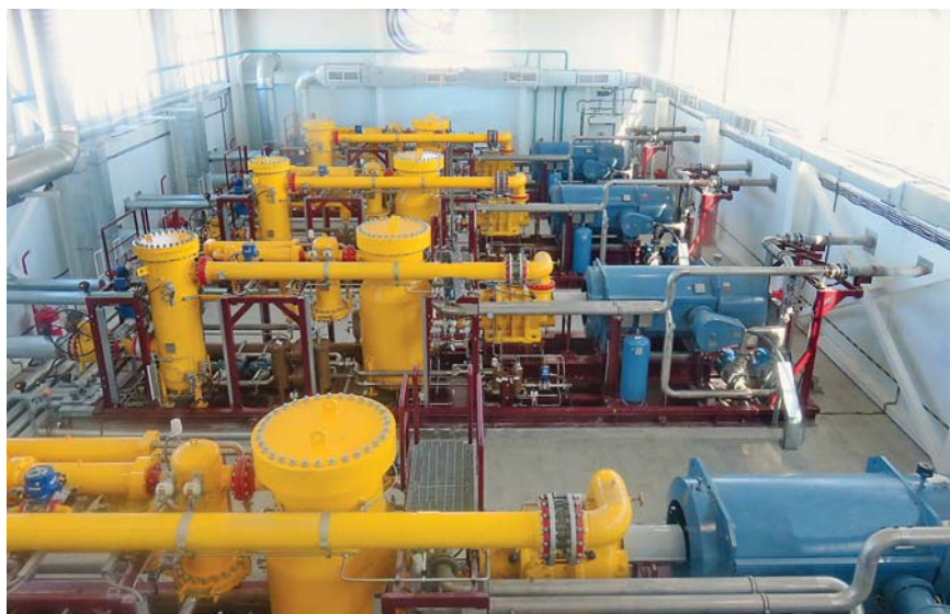
Фото 2. Установка подготовки топливного газа для ГТЭС Восточно-Мессояхского месторождения

ЦПО функционирует на Западно-Сургутском месторождении в Ханты-Мансий-