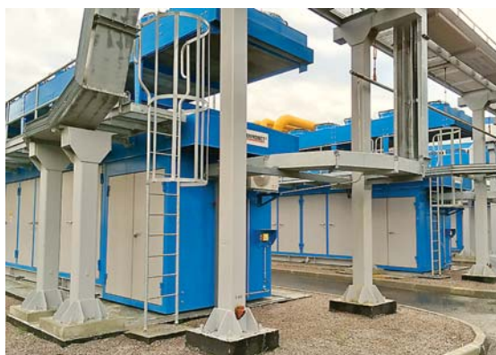
Фото 1. ДКС топливного газа для ГТУ–ТЭЦ Центральной ТЭЦ С.-Петербурга

Все работы по вводу системы газоподготовки, включая шефмонтаж, пусконаладку, собственные испытания и комплексное тестирование в составе ГТУ–ТЭЦ, выполнили технические специалисты ООО «СервисЭнергаз» (Группа «Энергаз»).