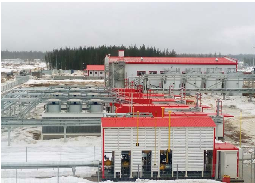
Фото 8. Система газоподготовки и газоснабжения энергоцентра «Ярега»

испытываемых турбин топливным газом с необходимыми параметрами.