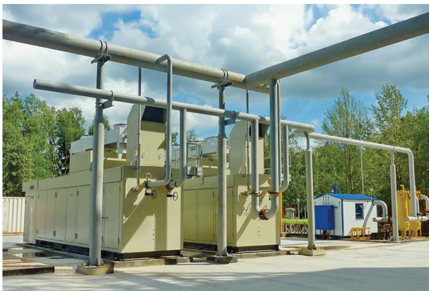
Фото 6. Система газоподготовки для автономной ГПЭС завода микроэлектроники «Ангстрем-Т»