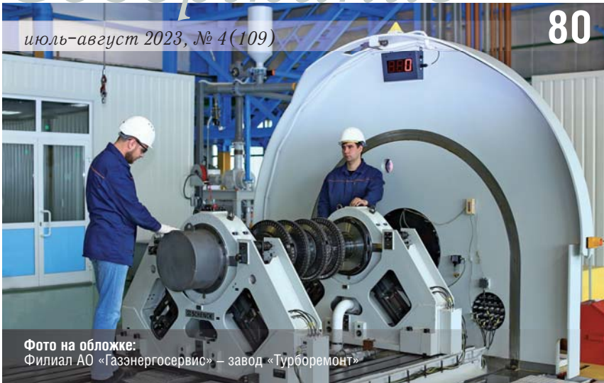
Фото на обложке: Филиал АО «Газэнергосервис» – завод «Турборемонт»