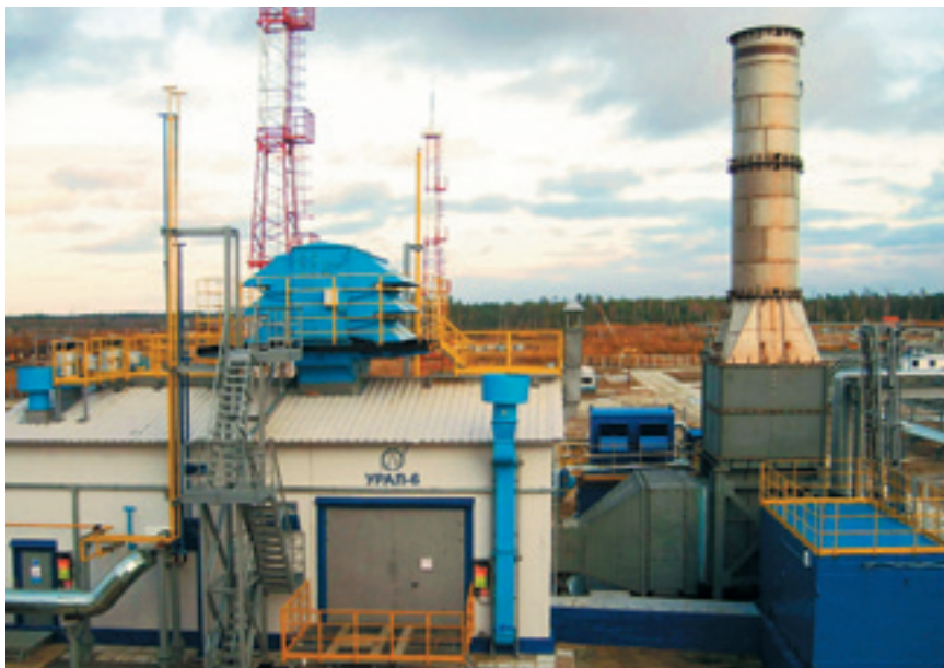
Компрессорный агрегат ГПА-6ДКС Урал

В служебно-эксплуатационном блоке, где расположится персонал станции, будет находиться главный щит управления станцией и газопроводом, административные и бытовые помещения. Система управления построена на основе программно-технических средств Siemens. Для удобства и оперативности обслуживания станции предусмотрен цех ремонтно-механической мастерской и теплый склад для ЗИП.