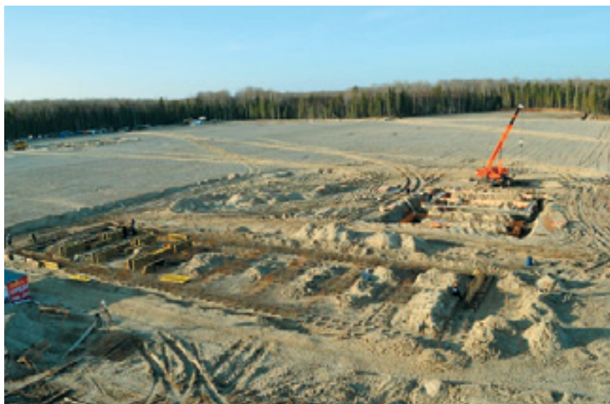
🕒 Начало строительства газокomppressorной станции

и на заданный режим, нормальный и аварийный останов агрегата. Основные параметры ГПА-6ДКС приведены в табл.