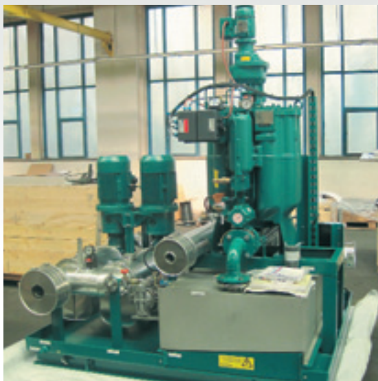
Модуль подогрева и подачи нефти

В модуле сепарации нефть очищается от механических примесей и воды. Основу модуля составляют два барабанных сепаратора, в которые нефть подается питающими насосами из емкости отстоя. Сепараторы оснащены саморазгружающимся тарельчатым барабаном. Примеси и вода во время автоматической очистки барабана отводятся в шламовую цистерну, а очищенная нефть через центральный канал