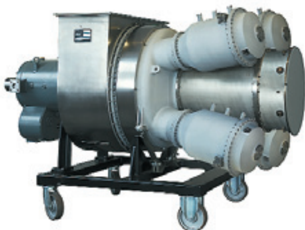
➔ Камера сгорания 3С газовой турбины OP16 предназначена для работы на сырой нефти

Система подготовки топливной нефти имеет модульное исполнение. В качестве стандартного