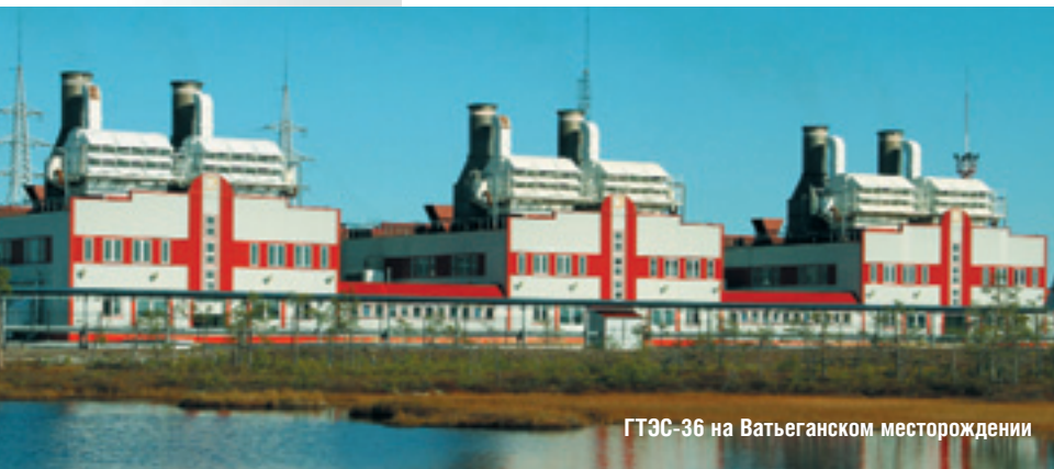
ГТЭС-36 на Ватьеганском месторождении

В настоящее время российские производители газотурбинного оборудования предлагают заказчикам услуги, которые, как правило, включают в себя работы по техническому обслуживанию в период плановых остановов. Данный вид услуг является стандартным