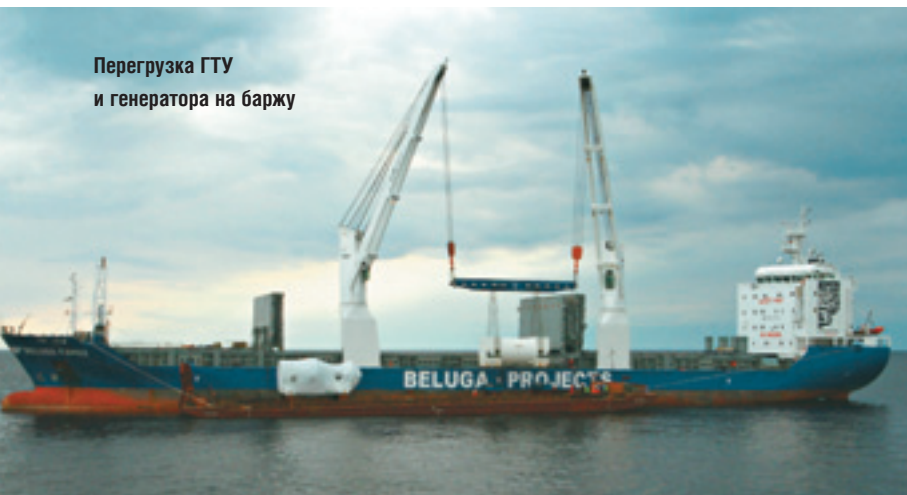
Перегрузка ГТУ и генератора на баржу

Турбины и генераторы были доставлены в Обскую губу 27 августа судном Beluga, оснащенным двумя кранами общей грузоподъемностью 300 т. Перегрузку оборудования на баржи выполнили прямо на внешнем рейде. Это был наиболее сложный момент транспортировки, поскольку оборудование необходимо было точно установить на подготовленные подставки, а работы производились в открытом море. Если